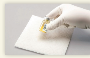
Figure 2 : Taper le flacon fermement pour mélanger.