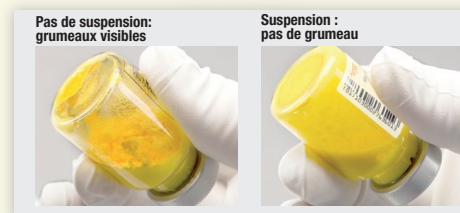
Figure 3 : Vérifier si de la poudre n'est pas en suspension et taper à nouveau si nécessaire.