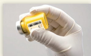
Figure 4 : Secouer vigoureusement le flacon.