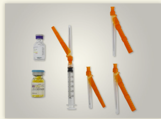
Figure 1 : Contenu du conditionnement.

Le conditionnement contient : (voir Figure 1)