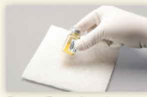
Figure 2 : Taper le flacon fermement pour mélanger.