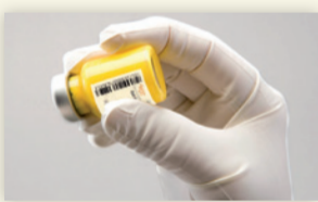
Figure 4 : Secouer vigoureusement le flacon.