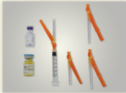
Figure 1 : Contenu du conditionnement.

Le conditionnement contient : (voir Figure 1)