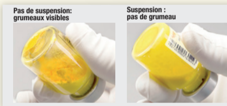
Figure 3 : Vérifier si de la poudre n'est pas en suspension et taper à nouveau si nécessaire.